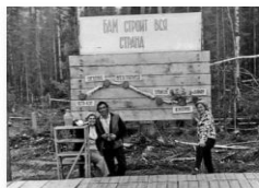
Если бы не плечо рядом...