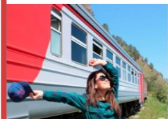
БАМ - железная дорога романтиков