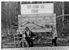
Если бы не плечо рядом...