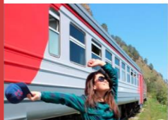
БАМ - железная дорога романтиков